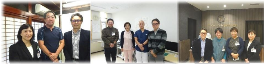
古藤医院・石川医院